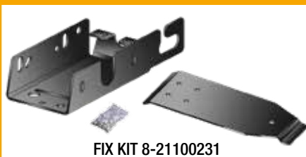
FIX KIT 8-21100231