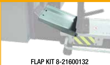
FLAP KIT 8-21600132