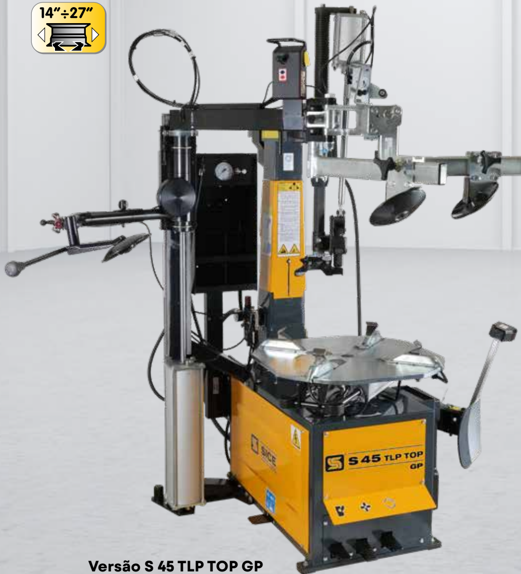
Versão S 45 TLP TOP GP

Desmontadora automática "LevalaLeva" totalmente equipada